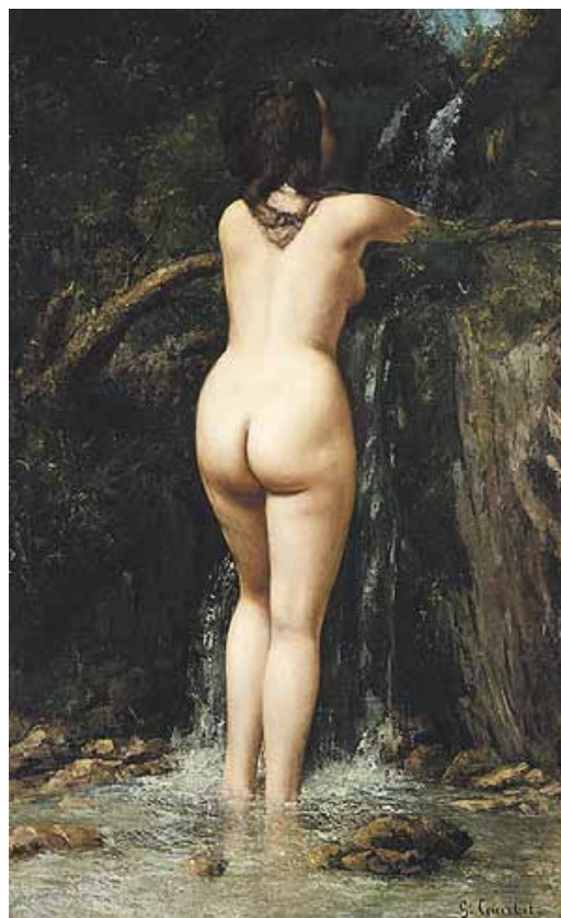
Gustave Courbet La Source, 1868 Paris, Musée d'Orsay