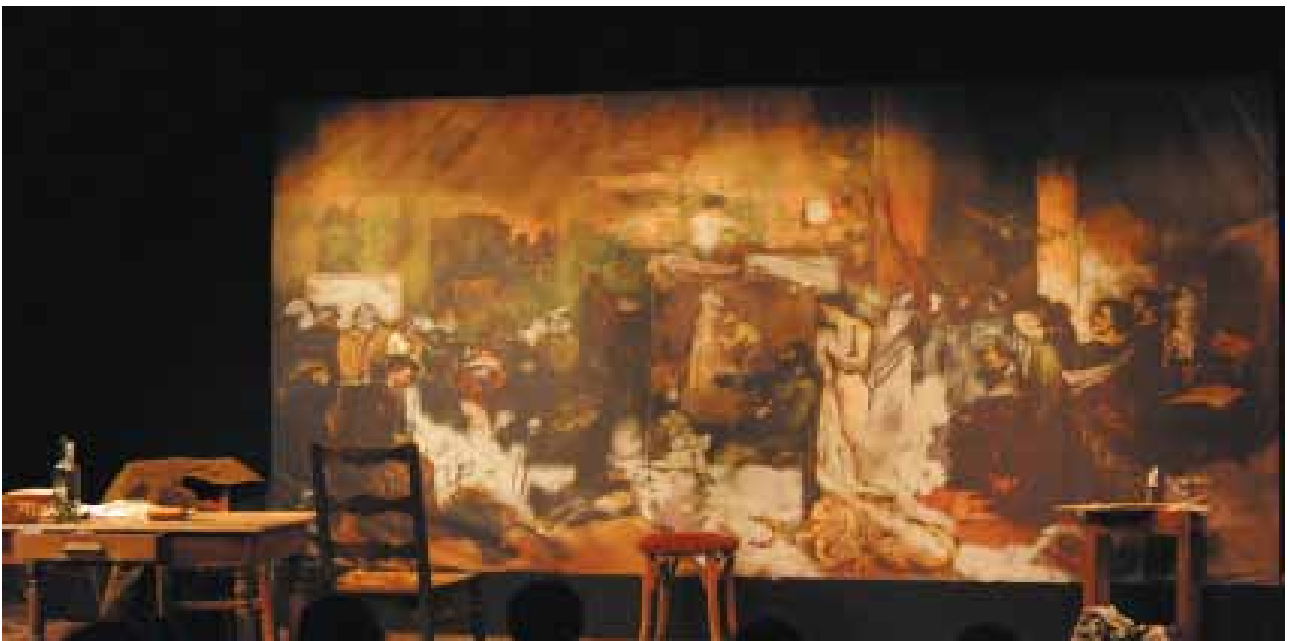
«L'Atelier» : sur fond de toile en travail (4 x 3 mètres)

Un tulle en vénitienne sépare l'espace scénique du spectateur et ponctue le spectacle de références de l'art pictural de Courbet.